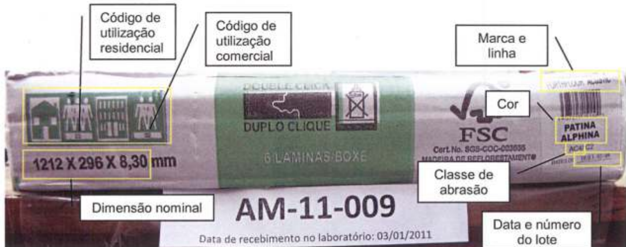
Foto 2 – Informações impressas na embalagem da amostra recebida: códigos do sistema de classificação para categorias de utilização (detalhe ampliado), dimensão nominal, marca, linha, cor ou padrão, classe de abrasão, data e número do lote.