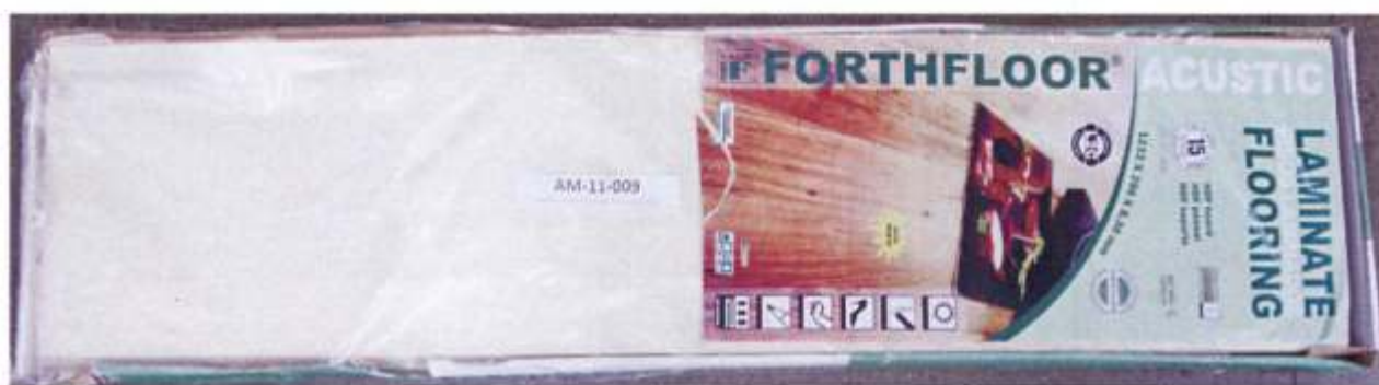
Foto 1 – Amostra de piso laminado FORTHFLOOR linha ACUSTIC recebida no laboratório.

A foto 1 ilustra a impressão da marca na amostra recebida, evidenciando que trata-se de piso laminado FORTHFLOOR, linha ACUSTIC.