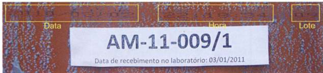
Foto 3 – Informações impressas no verso de uma placa retirada da amostra: data (ano/mês/dia), hora e número de lote.