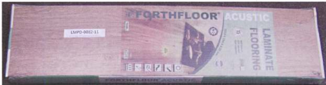
Foto 1 – Amostra de piso laminado FORTHFLOOR linha ACUSTIC recebida no laboratório.

A foto 1 ilustra a impressão da marca na amostra recebida, evidenciando que trata-se de piso laminado FORTHFLOOR, linha ACUSTIC.