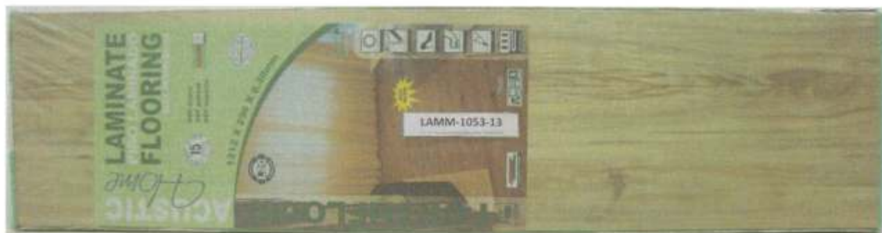
Foto 1 – Amostra de piso laminado FORTHFLOOR linha ACUSTIC recebida no laboratório.

A Foto 1 ilustra a impressão da marca na amostra recebida, evidenciando que trata-se de piso laminado FORTHFLOOR, linha ACUSTIC.