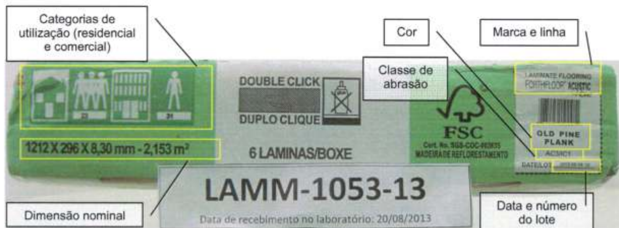
Foto 2 – Informações impressas na embalagem da amostra recebida: códigos do sistema de classificação para categorias de utilização, dimensão nominal, marca, linha, cor ou padrão, classe de abrasão, data e número do lote.