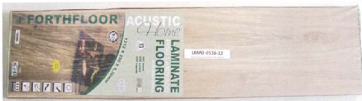
Foto 1 – Amostra de piso laminado FORTHFLOOR linha ACUSTIC HOME recebida no laboratório.

A Foto 1 ilustra a impressão da marca na amostra recebida, evidenciando que trata-se de piso laminado FORTHFLOOR, linha ACUSTIC HOME.