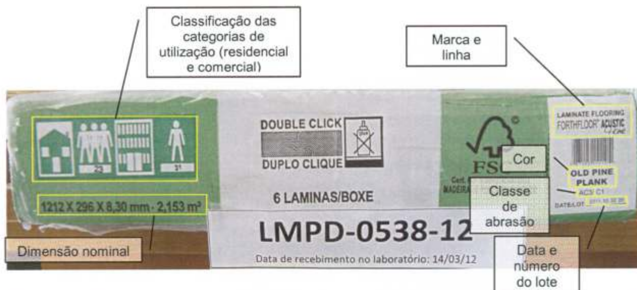
Foto 2 – Informações impressas na embalagem da amostra recebida: códigos do sistema de classificação para categorias de utilização, dimensão nominal, marca, linha, cor ou padrão, classe de abrasão, data e número do lote.