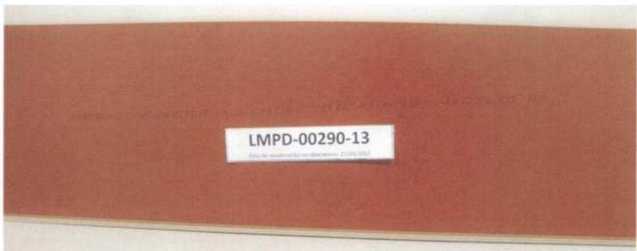
Foto 3 – Informações impressas no verso de uma placa retirada da amostra: marca comercial, linha, classe de abrasão, país de origem, data (ano/mês/dia) e hora de fabricação.