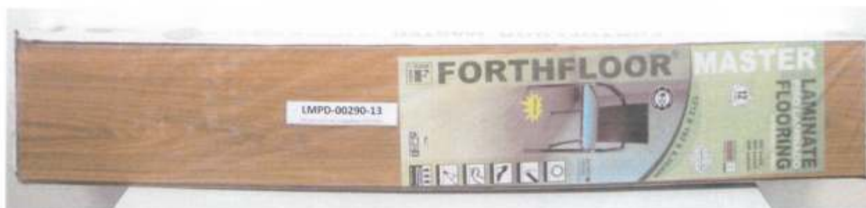
Foto 1 – Amostra de piso laminado FORTHFLOOR linha MASTER CARVALHO recebida no laboratório.

A Foto 1 ilustra a impressão da marca na amostra recebida, evidenciando que trata-se de piso laminado FORTHFLOOR, linha MASTER CARVALHO.