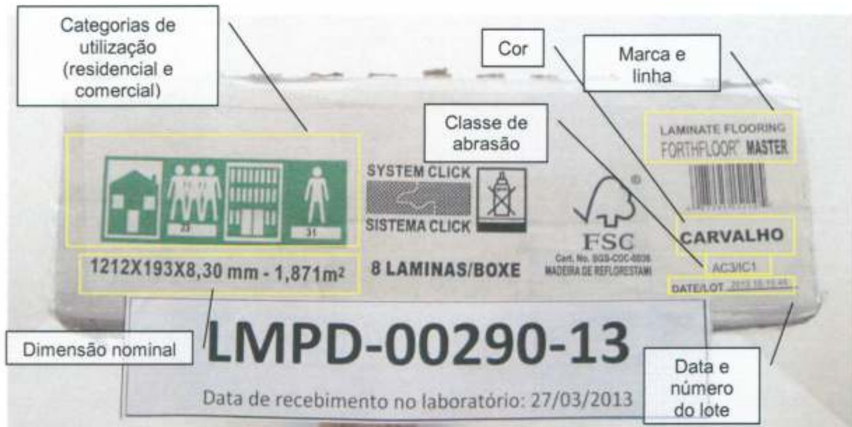
Foto 2 – Informações impressas na embalagem da amostra recebida: códigos do sistema de classificação para categorias de utilização, dimensão nominal, marca, linha, cor ou padrão, classe de abrasão, data e número do lote.