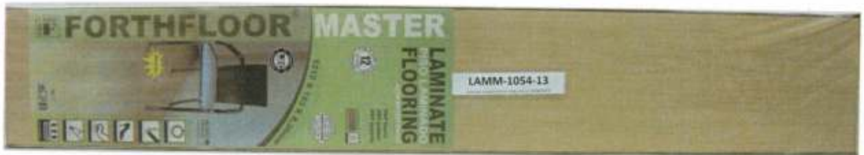
Foto 1 – Amostra de piso laminado FORTHFLOOR linha MASTER recebida no laboratório.

A Foto 1 ilustra a impressão da marca na amostra recebida, evidenciando que trata-se de piso laminado FORTHFLOOR, linha MASTER.