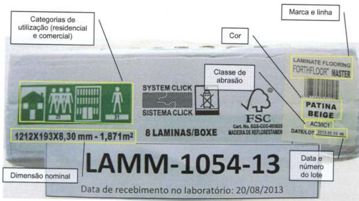
Foto 2 – Informações impressas na embalagem da amostra recebida: códigos do sistema de classificação para categorias de utilização, dimensão nominal, marca, linha, cor ou padrão, classe de abrasão, data e número do lote.