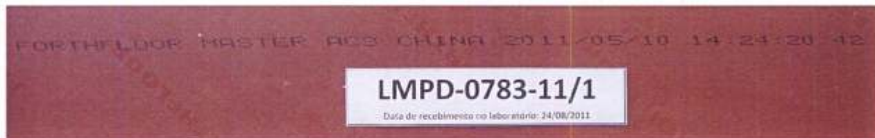
Foto 4 – Informações impressas no verso de uma placa retirada da amostra: marca comercial, linha, classe de abrasão, país de origem, data (ano/mês/dia), hora de fabricação e número de lote.