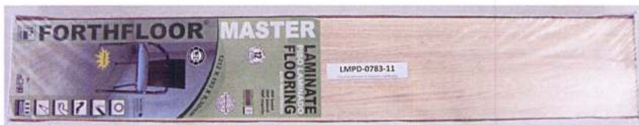
Foto 1 – Amostra de piso laminado FORTHFLOOR linha MASTER recebida no laboratório.

A foto 1 ilustra a impressão da marca na amostra recebida, evidenciando que trata-se de piso laminado FORTHFLOOR, linha MASTER.