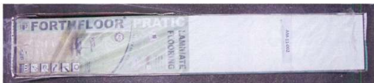
Foto 1 – Amostra de piso laminado FORTHFLOOR linha PRATIC recebida no laboratório.

A foto 1 ilustra a impressão da marca na amostra recebida, evidenciando que trata-se de piso laminado FORTHFLOOR, linha PRATIC.