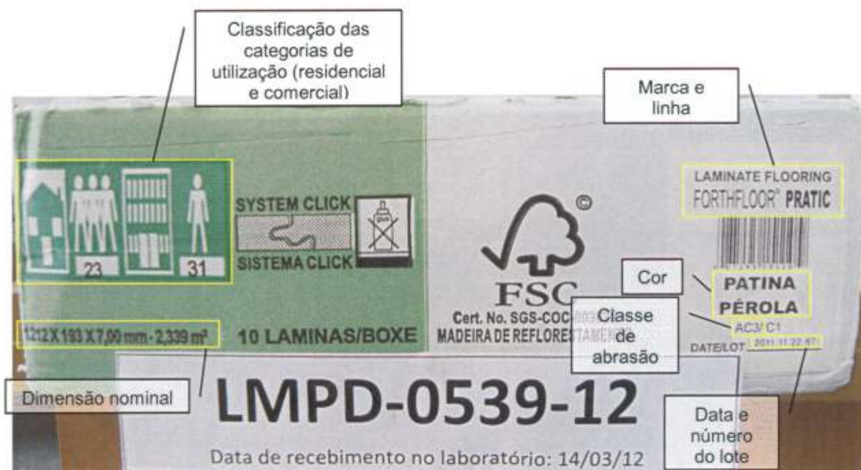
Foto 2 – Informações impressas na embalagem da amostra recebida: códigos do sistema de classificação para categorias de utilização, dimensão nominal, marca, linha, cor ou padrão, classe de abrasão, data e número do lote.