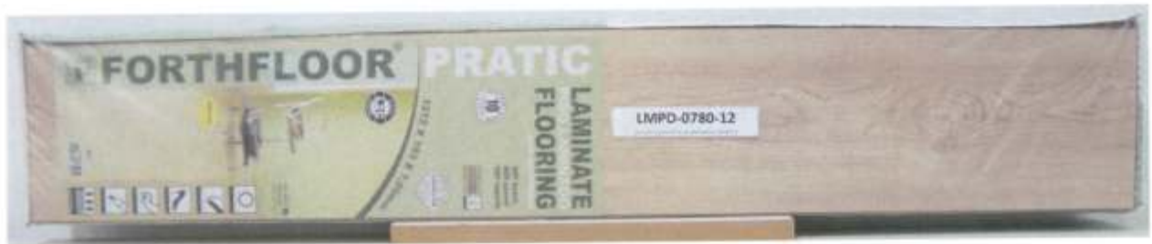
Foto 1 – Amostra de piso laminado FORTHFLOOR linha PRATIC recebida no laboratório.

A Foto 1 ilustra a impressão da marca na amostra recebida, evidenciando que trata-se de piso laminado FORTHFLOOR, linha PRATIC.