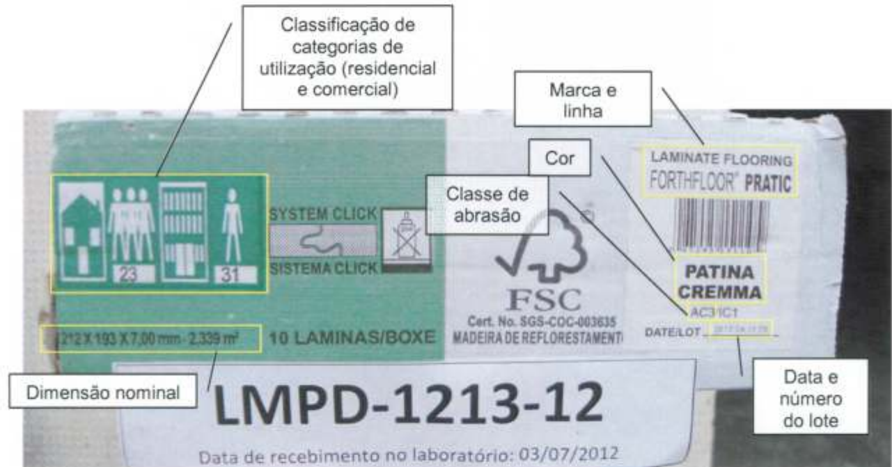
Foto 2 – Informações impressas na embalagem da amostra recebida: códigos do sistema de classificação para categorias de utilização, dimensão nominal, marca, linha, cor ou padrão, classe de abrasão, data e número do lote.