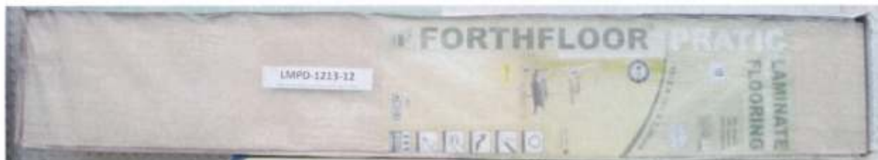
Foto 1 – Amostra de piso laminado FORTHFLOOR linha PRATIC recebida no laboratório.

A Foto 1 ilustra a impressão da marca na amostra recebida, evidenciando que trata-se de piso laminado FORTHFLOOR, linha PRATIC.