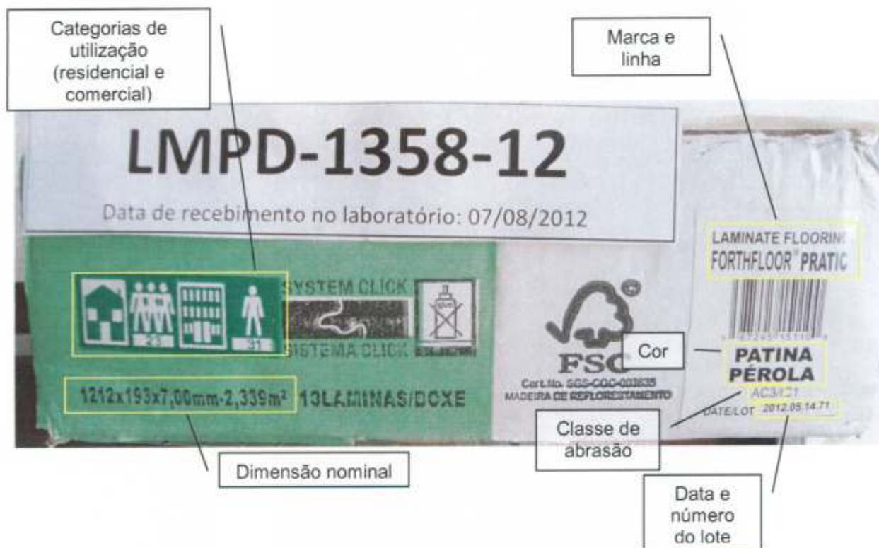
Foto 2 – Informações impressas na embalagem da amostra recebida: códigos do sistema de classificação para categorias de utilização, dimensão nominal, marca, linha, cor ou padrão, classe de abrasão, data e número do lote.