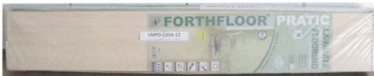
Foto 1 – Amostra de piso laminado FORTHFLOOR linha PRATIC recebida no laboratório.

A Foto 1 ilustra a impressão da marca na amostra recebida, evidenciando que trata-se de piso laminado FORTHFLOOR, linha PRATIC.