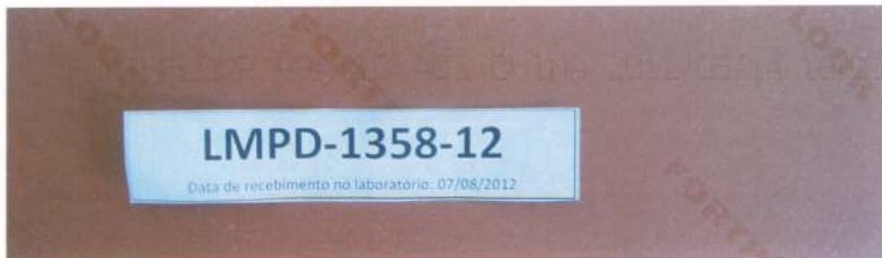
Foto 3 – Informações impressas no verso de uma placa retirada da amostra: marca comercial, linha, classe de abrasão, país de origem, data (ano/mês/dia) e hora de fabricação.