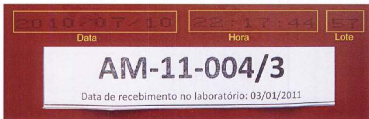
Foto 4 – Informações impressas no verso de uma placa retirada da amostra: data (ano/mês/dia), hora e número de lote.