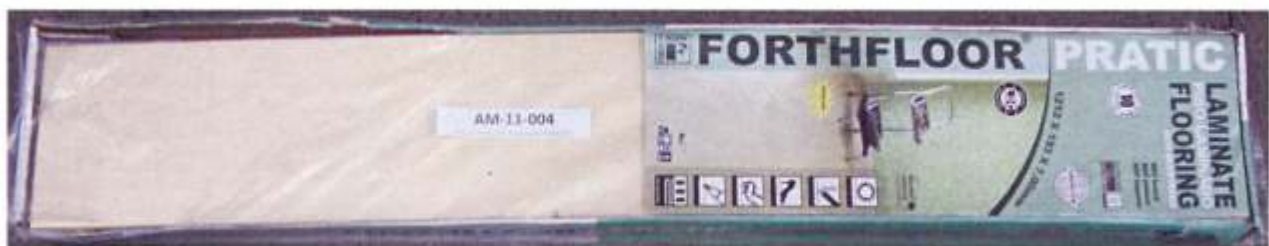
Foto 1 – Amostra de piso laminado FORTHFLOOR linha PRATIC recebida no laboratório.

A foto 1 ilustra a impressão da marca na amostra recebida, evidenciando que trata-se de piso laminado FORTHFLOOR, linha PRATIC.